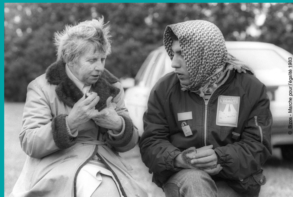
Marche pour l'égalité 1983

Coordination générale du Printemps de la Mémoire